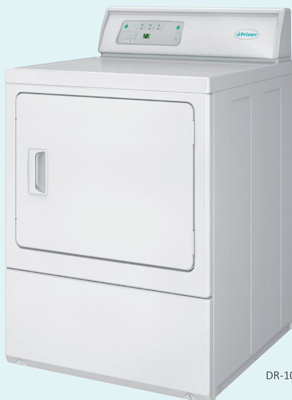
DR-10 P I