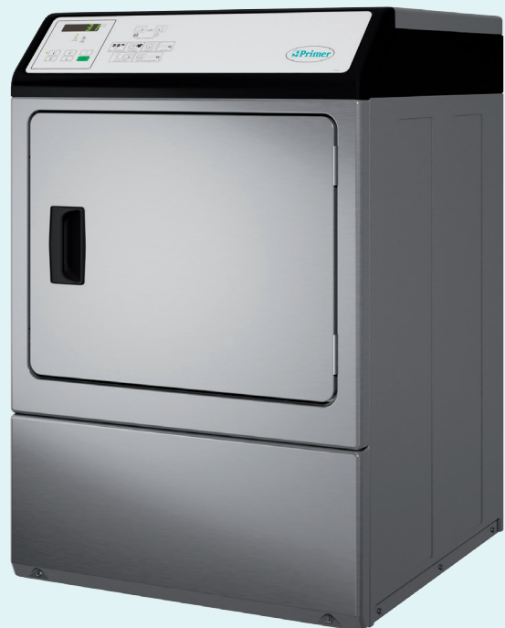
DR-10 P III inox